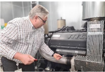
Ihre Perspektiven bei uns!